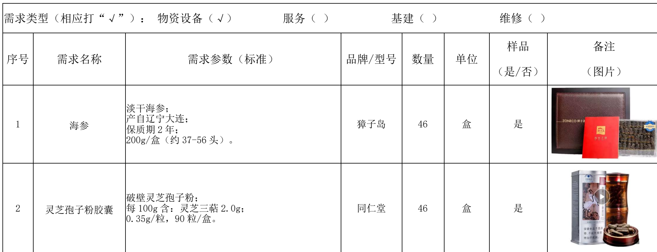
广州体育职业技术学院 2020 年奥运跟踪重点运动员营养品采购采购项目需求表